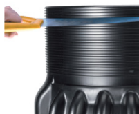
Höjd justeras genom kapning