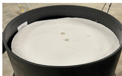
Isolering under locket