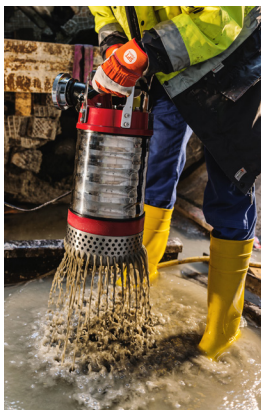
Tryckhöjd (m) P337D