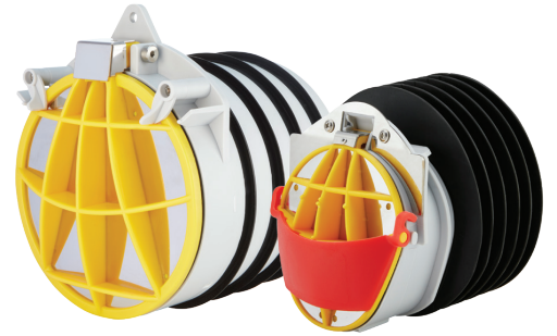
IBKLU-150 För DN150 rör IBKLU-100 För DN100 rör