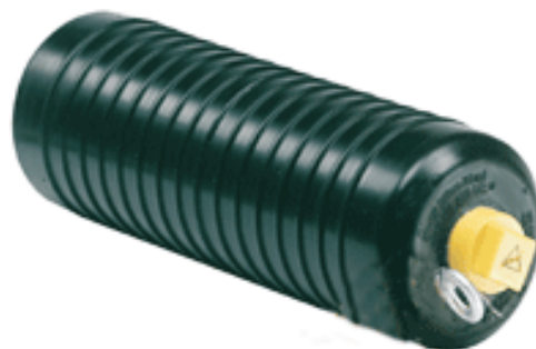
Cherne flx Muni-Boll förberedd för seriekoppling

Hittar man då en läcka så kan man mäta sig fram till var läckan är mer exakt genom att skjuta propparna fram och tillbaka tills man har ringat in själva läckan. Detta förutsätter att man kan dra propparna och slangarna fram och tillbaka med hjälp av wire eller linor i båda ändarna.